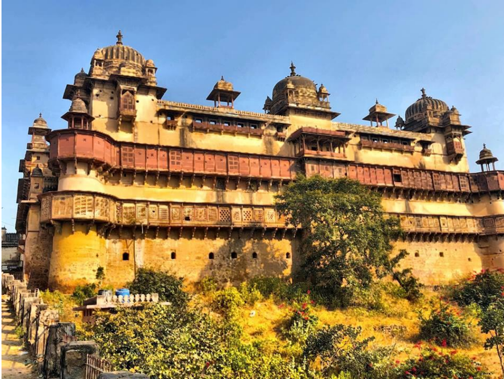
Három 16-17. századi palota maradt meg: a Rádzs Mahal (1560), a Dzsahángíri Mahal (1626) és a Ráji Pravín Mahal (1675).