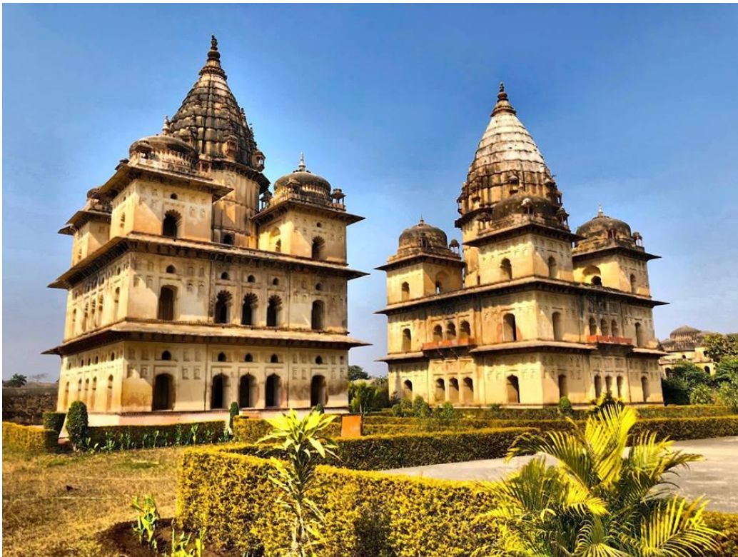
Ezek szimmetrikus elrendezésben egy tömböt alkotnak.